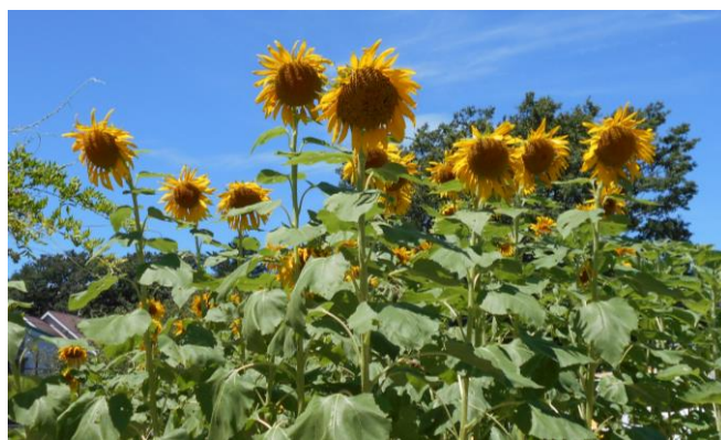
つばき公園のひまわり 8月11日撮影